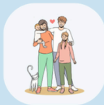
لم شمل الأسرة