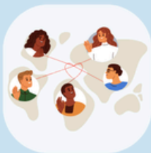
الكفالات الخاصة والمجتمعية