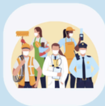
مسارات التوظيف/ العمالة

لمعرفة المزيد عن المسارات التكميلية وكيفية التقديم لفرصها المختلفة، يرجى زيارة موقع الدعم الخاص بنا: