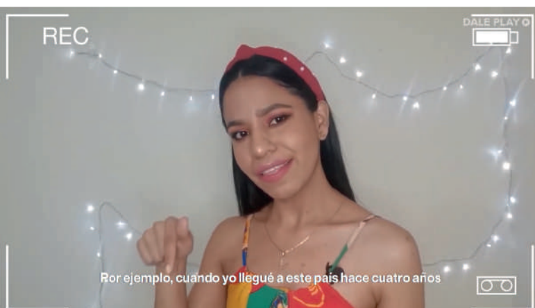
Por ejemplo, cuando yo llegué a este país hace cuatro años

Para ver estos contenidos búscalos en YouTube como Dale Play Ec y en Instagram y Tik Tok como @ecuadordaleplay.