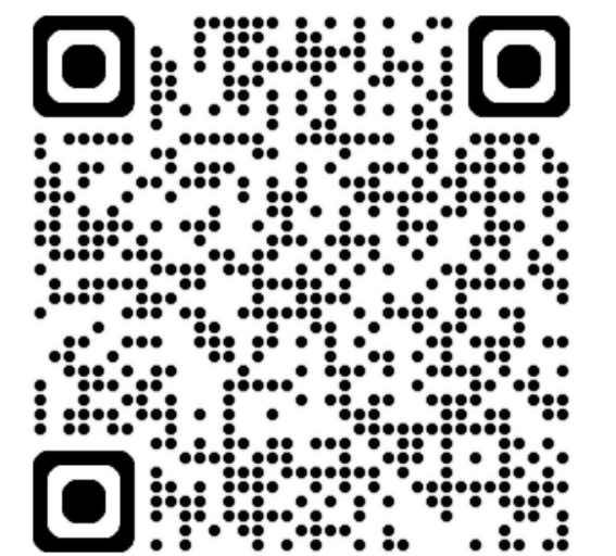
УВКБ ООН в Болгарии Канал в WhatsApp

Вся помощь УВКБ ООН является бесплатной.