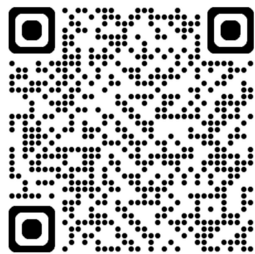
УВКБ ООН в Болгарии Телеграм-канал

С ноября по декабрь 2024 года семьи, имеющие право на участие в программе, получают SMS-сообщение на ваш номер мобильного телефона. В этом SMS будет указано, как вы можете получить деньги через Western Union.