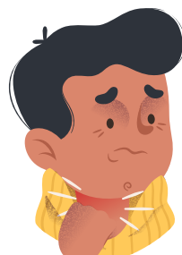
DIFICULDADE DE RESPIRAR E/OU SECREÇÃO NA GARGANTA